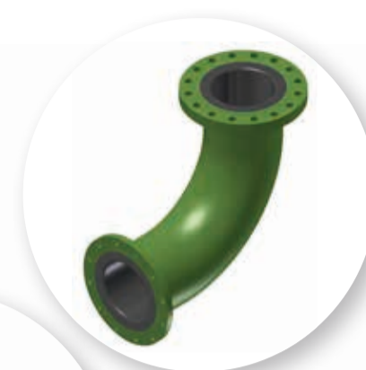
ACERO CARBONO CON REVESTIMIENTO DE GOMA