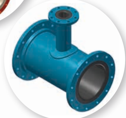
ACERO CARBONO CON REVESTIMIENTO DE HDPE