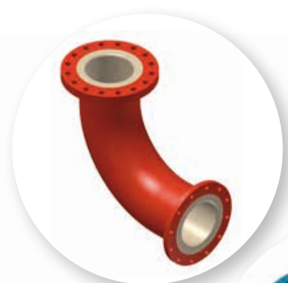
ACERO CARBONO CON REVESTIMIENTO DE POLIURETANO